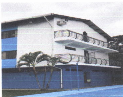
Complejo Roberto Gilbert