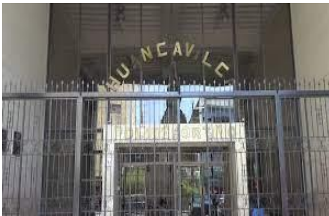
Cuadro N° 3